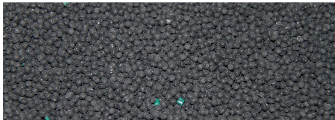
HDPE Kunststoff-Regenerat, wertvoller Produktions-Rohstoff der Universalpalette